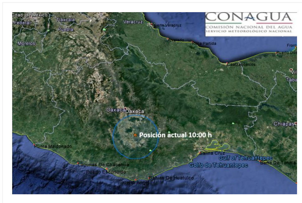
Traectoria pronostico de la Baja Presión Remanente de "Calvin"